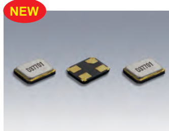
DSX1612SL 原寸大 □